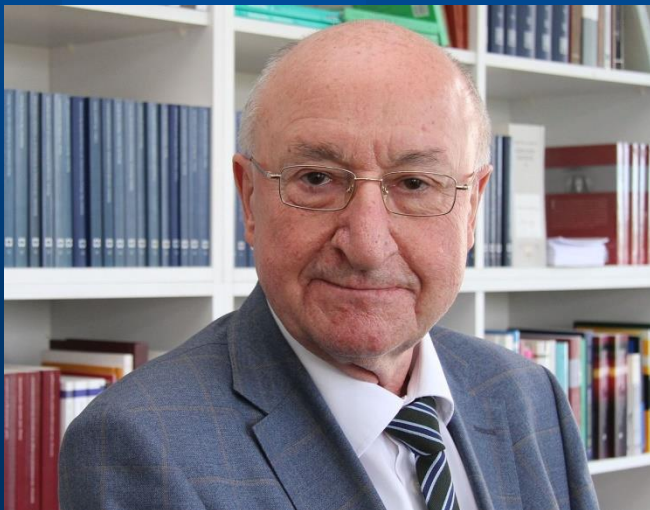
Robert Alexy (1945-) Njemačka