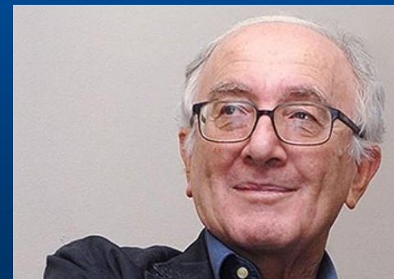
Luigi Ferrajoli (1940-), Italija