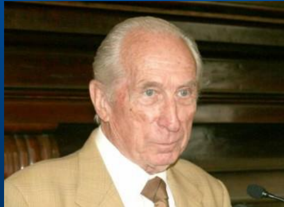
Eugenio Bulygin (1931-) Argentina